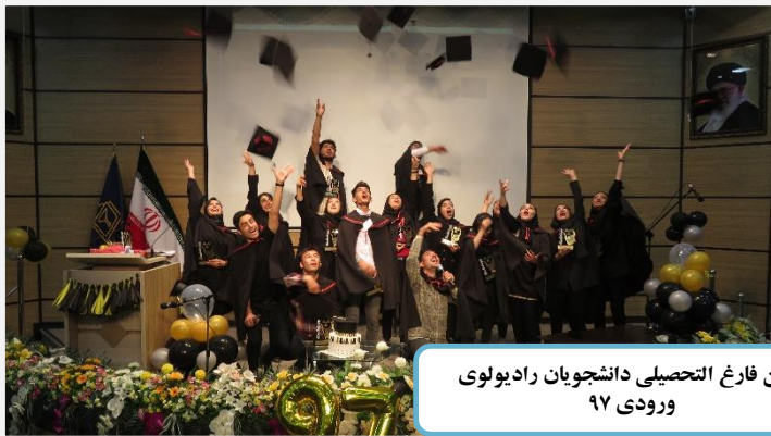
جشن فارغ التحصیلی دانشجویان رادیولوژی ورودی ۹۷