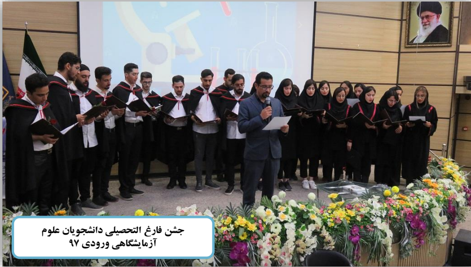
جشن فارغ التحصیلی دانشجویان علوم آزمایشگاهی ورودی ۹۷