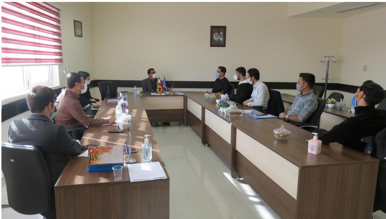
برگزاری جلسه هم اندیشه دانشجویان با ریاست دانشکده پزشکی در آستانه روز دانشجو