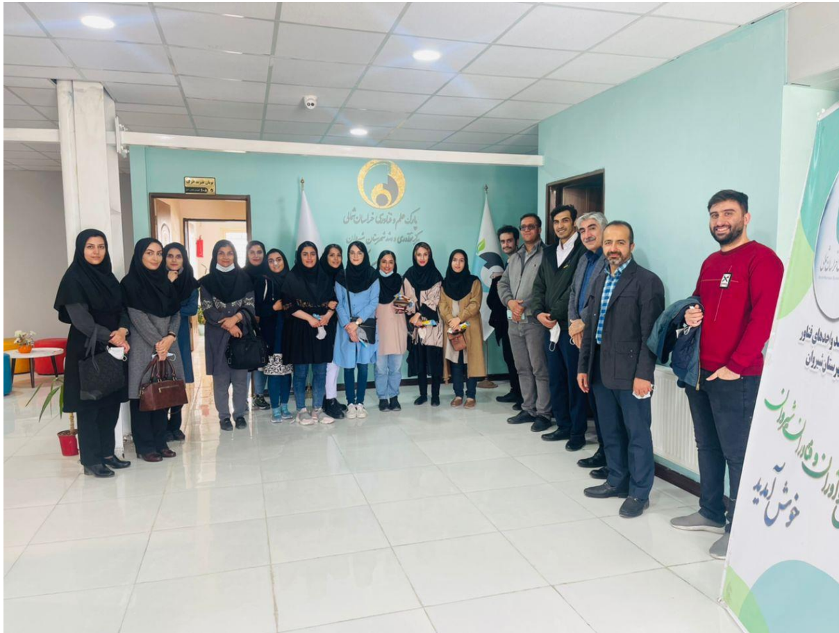
بازدید یک گروه علمی از اساتید و دانشجویان دانشکده پزشکی از مرکز رشد شیراز