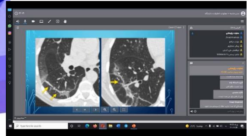
بیماری های ریوی با محوریت کرونا» برگزار شد

گزیده ای از فعالیت انجمن های علمی دانشجویان دانشکده پزشکی