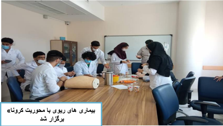
بیماری های ریوی با محوریت کرونا» برگزار شد

برگزاری کارگاه تشخیص نورواناتومیک در نورولوژی