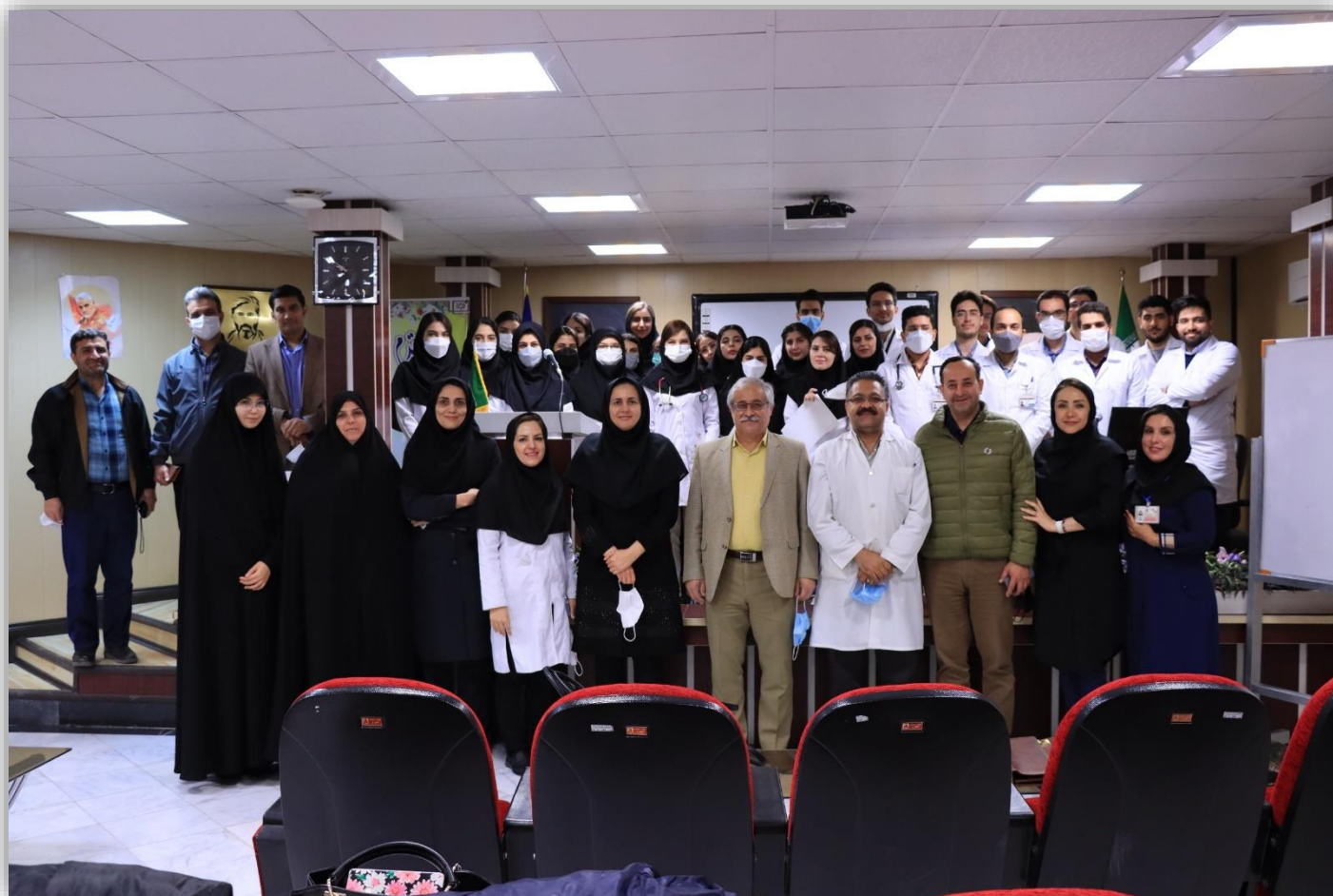
برگزاری آیین روپوش سفید جهت دانشجویان استاژر