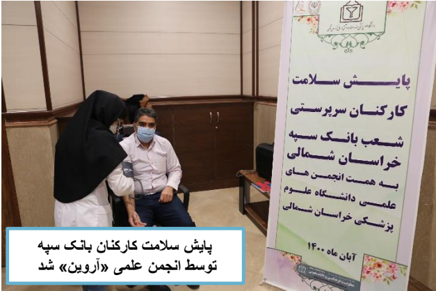
پایش سلامت کارکنان بانک سپه توسط انجمن علمی «آروین» شد

برگزاری کارگاه تشخیص نورواناتومیک در نورولوژی