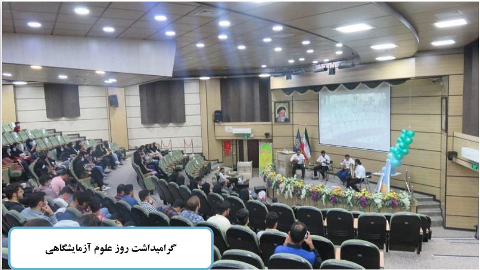
گرومیداشت روز علوم آزمایشگاهی